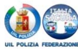
Uil Polizia - Anip Cosi